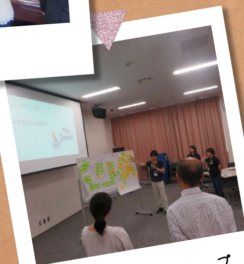
総合診療ワークショップ